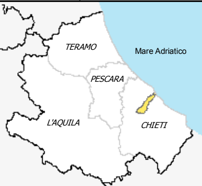
Inquadramento Regionale della Scheda del Torrente Moro (scala 1:3.000.000)