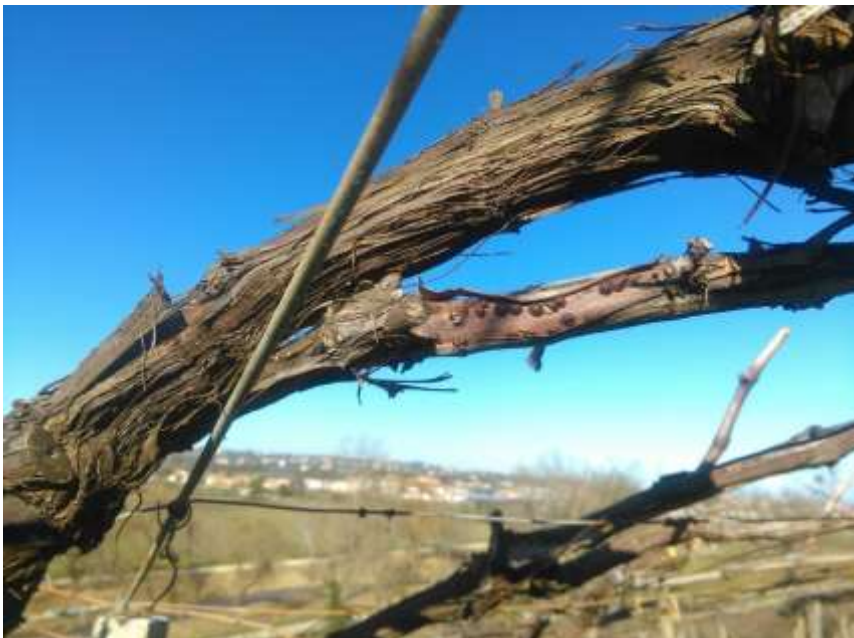
Cocciniglia nera della vite - Targionia vitis