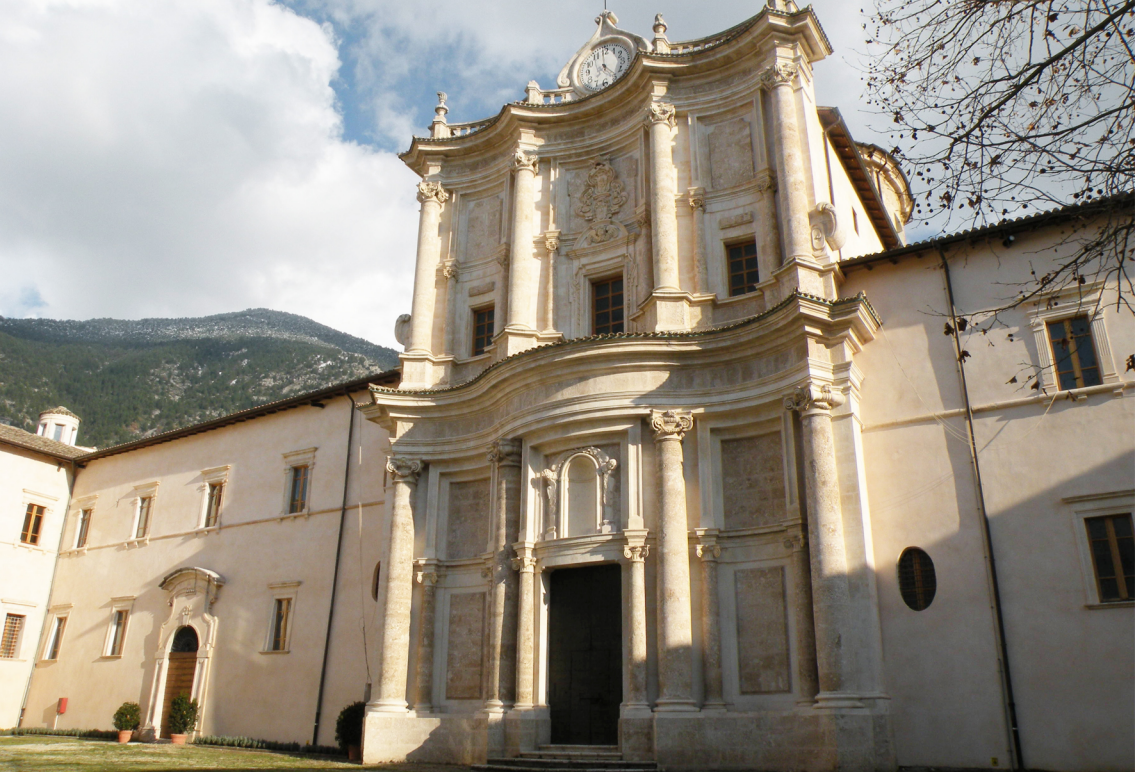
Chiesa della Spirito Santo alla Badia Morrone - Sulmona (AQ)