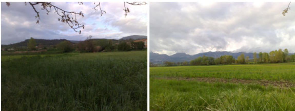
Fig. 3-5-6. Vista del sito