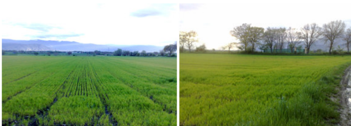
Fig. 3-11-12. Vista del sito