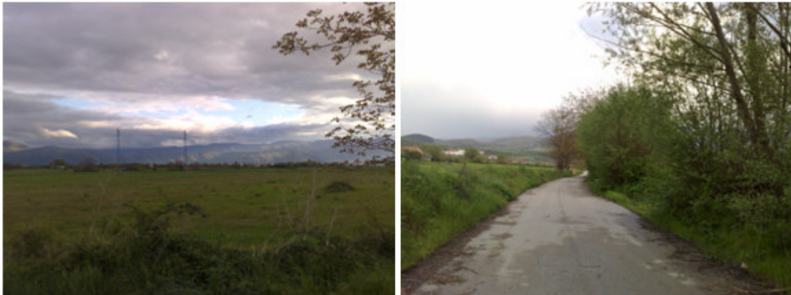
Fig. 3-3-4. Vista del sito

Ing. Pierfelice Valentina , via Attilio Forlani, 52 65012 Cepagatti (PE) 085/9749526