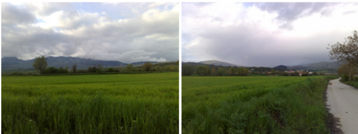
Fig. 3-1-2. Vista del sito