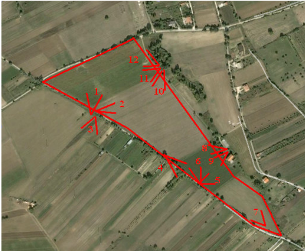
Fig. 2 Quadro insieme dei punti di vista delle immagini del sito

Ing. Pierfelice Valentina , via Attilio Forlani, 52 65012 Cepagatti (PE) 085/9749526