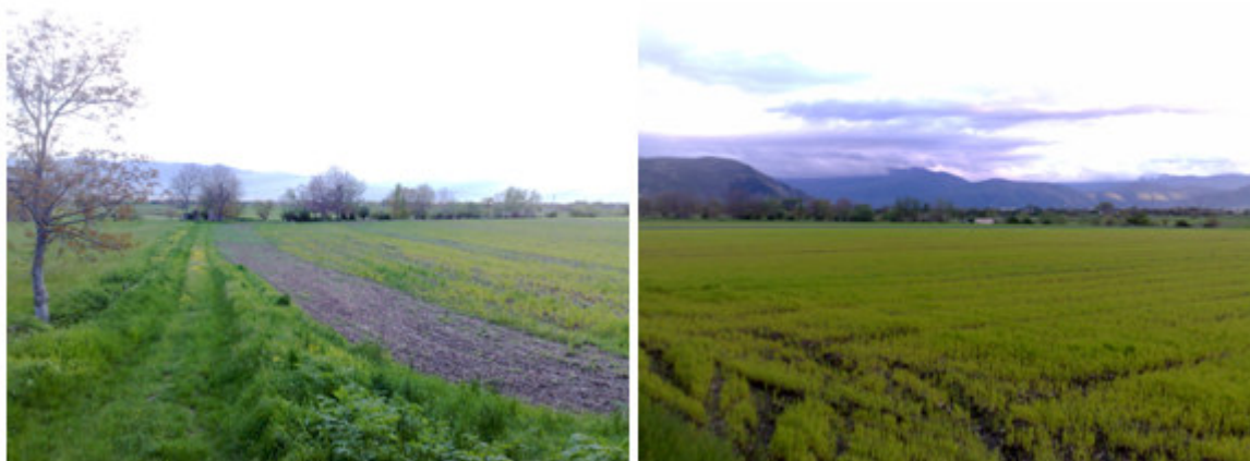
Fig. 3-9-10. Vista del sito

Ing. Pierfelice Valentina , via Attilio Forlani, 52 65012 Cepagatti (PE) 085/9749526