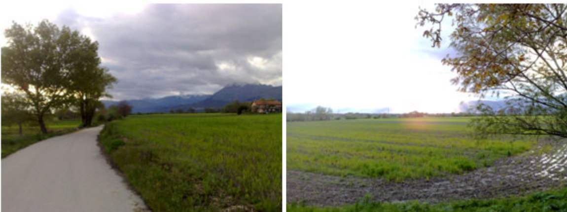
Fig. 3-7-8. Vista del sito