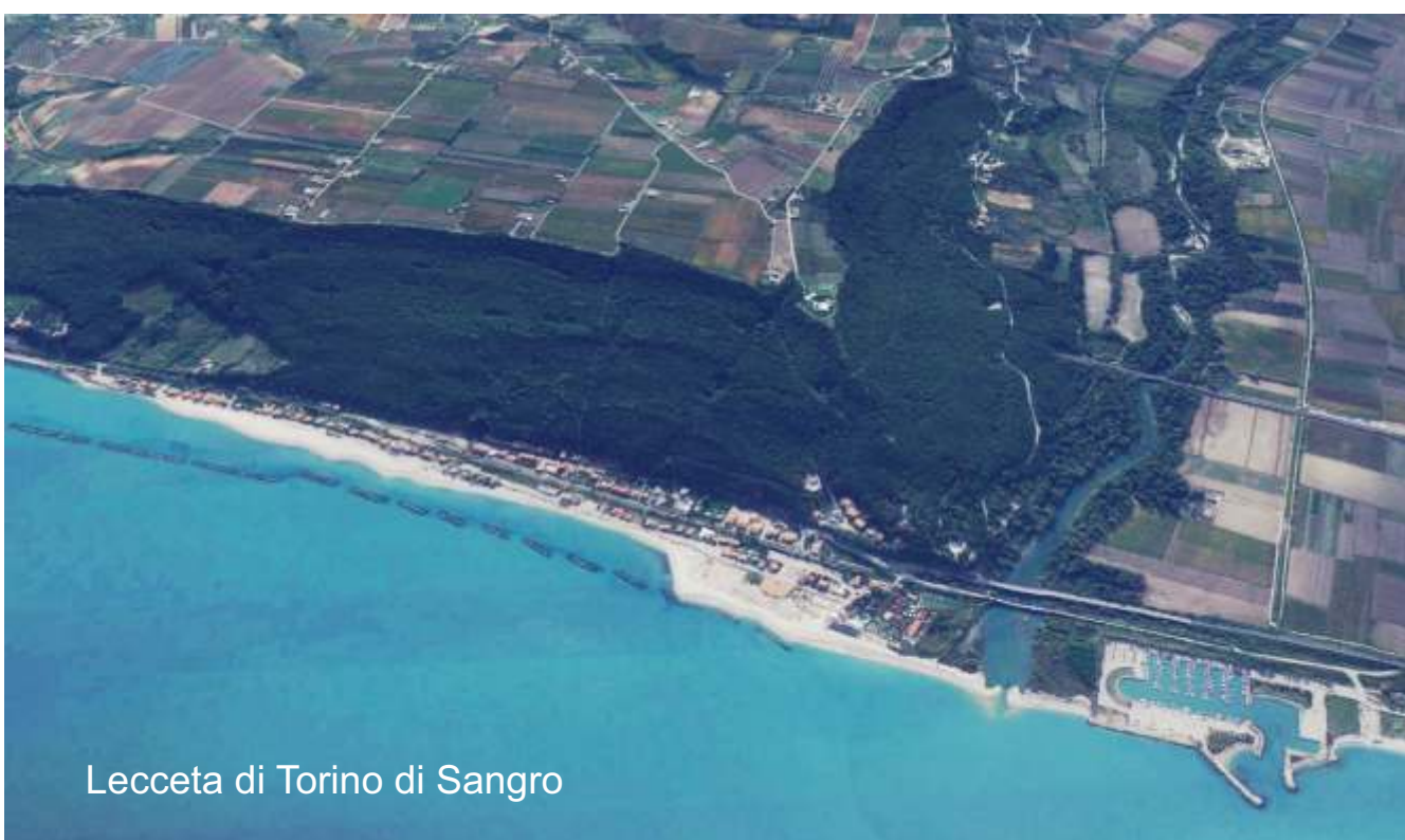
Lecce di Torino di Sangro