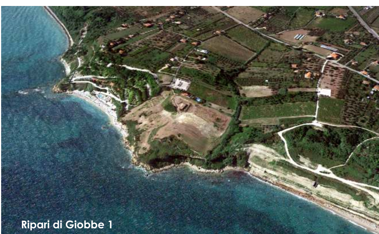
Ripari di Giobbe 1