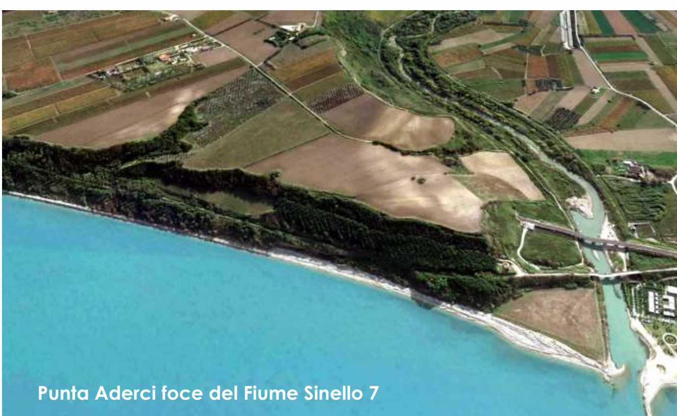
Punta Aderci foce del Fiume Sinello 7