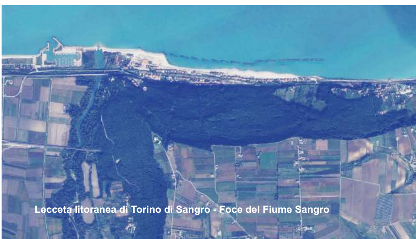
Lacceta litoranea di Torino di Sangro - Foce del Fiume Sangro

Valorizzazione e rigenerazione del paesaggio agricolo costiero. Tutela e salvaguardia delle aree caratterizzate dalla presenza del vigneto specializzato, dell'oliveto, del seminato arboreo e del frutteto (pianoro, pendio, crinale, valle). Limitazione della frammentazione delle aziende agricole e della parcellizzazione del territorio. Limitazione delle forme di alterazione del paesaggio rurale e storico-culturale-artistico costruito.