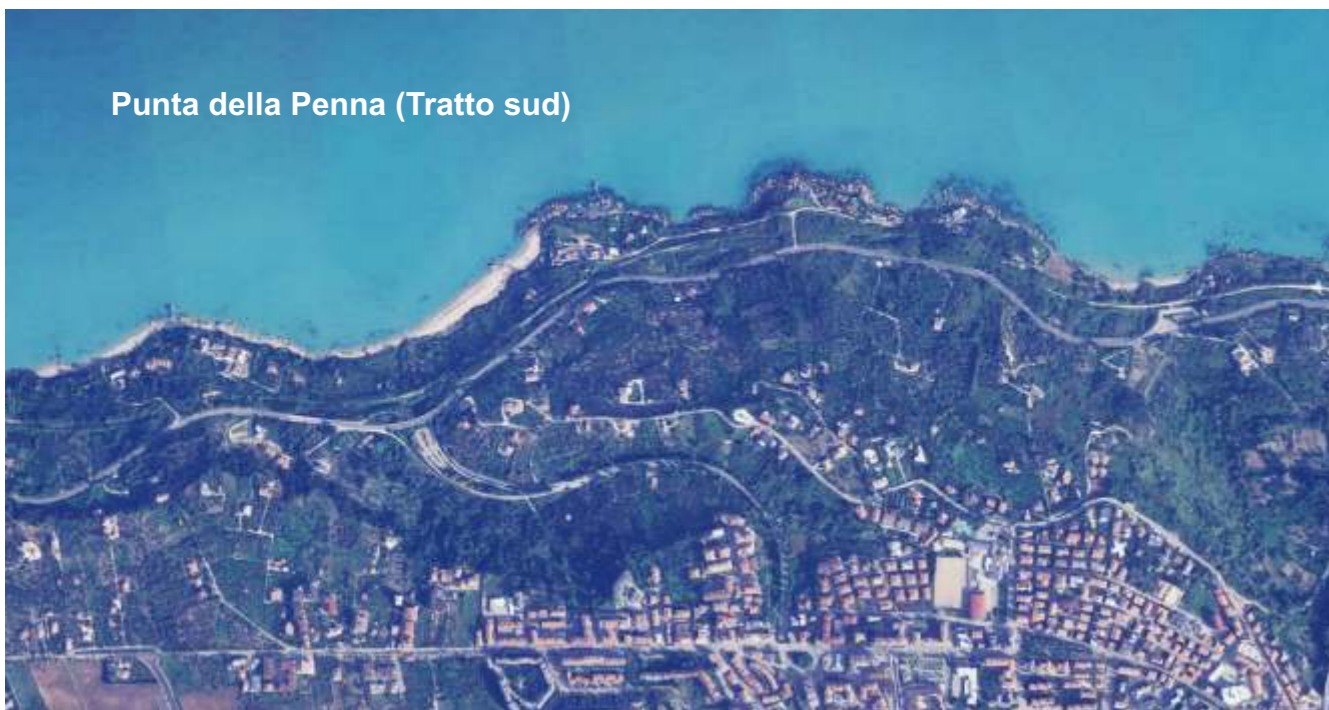
Punta della Penna (Tratto sud)