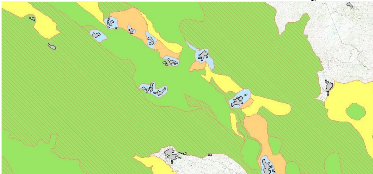
Piano Paesistico Regionale