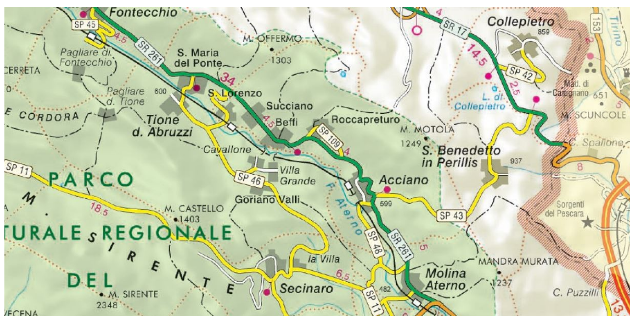
ESTRATTO CARTA DELLE STRADE PROVINCIALI

La S.P. 109 "di Roccapreturo" è ricompresa interamente nel territorio del Comune di Acciano, con innesto sulla S.R. 261 e si estende per un totale di 2,340 km.