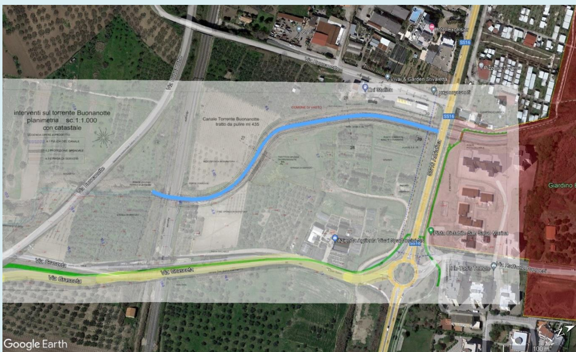
Figura 1 – Planimetria dell'alveo del torrente Buonanotte interessata dall'intervento (in azzurro) e del territorio limitrofo

Di seguito si riporta una planimetria dell'area interessata dall'intervento (in azzurro a sinistra) con indicazione dell'area della ZSC/Riserva (evidenziata in rosso sulla destra, parzialmente sovrapposta alla planimetria).