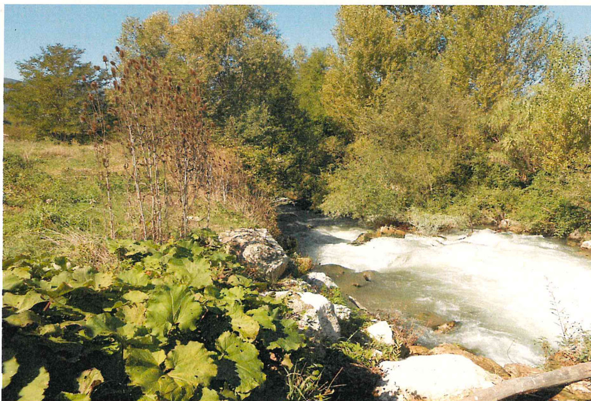
foto 4 vista del fiume da monte