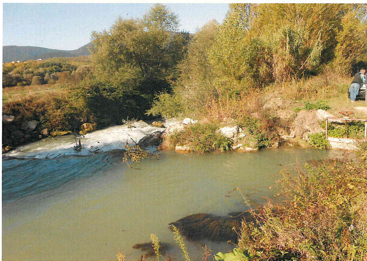
foto 8 vista del fiume e opera di presa