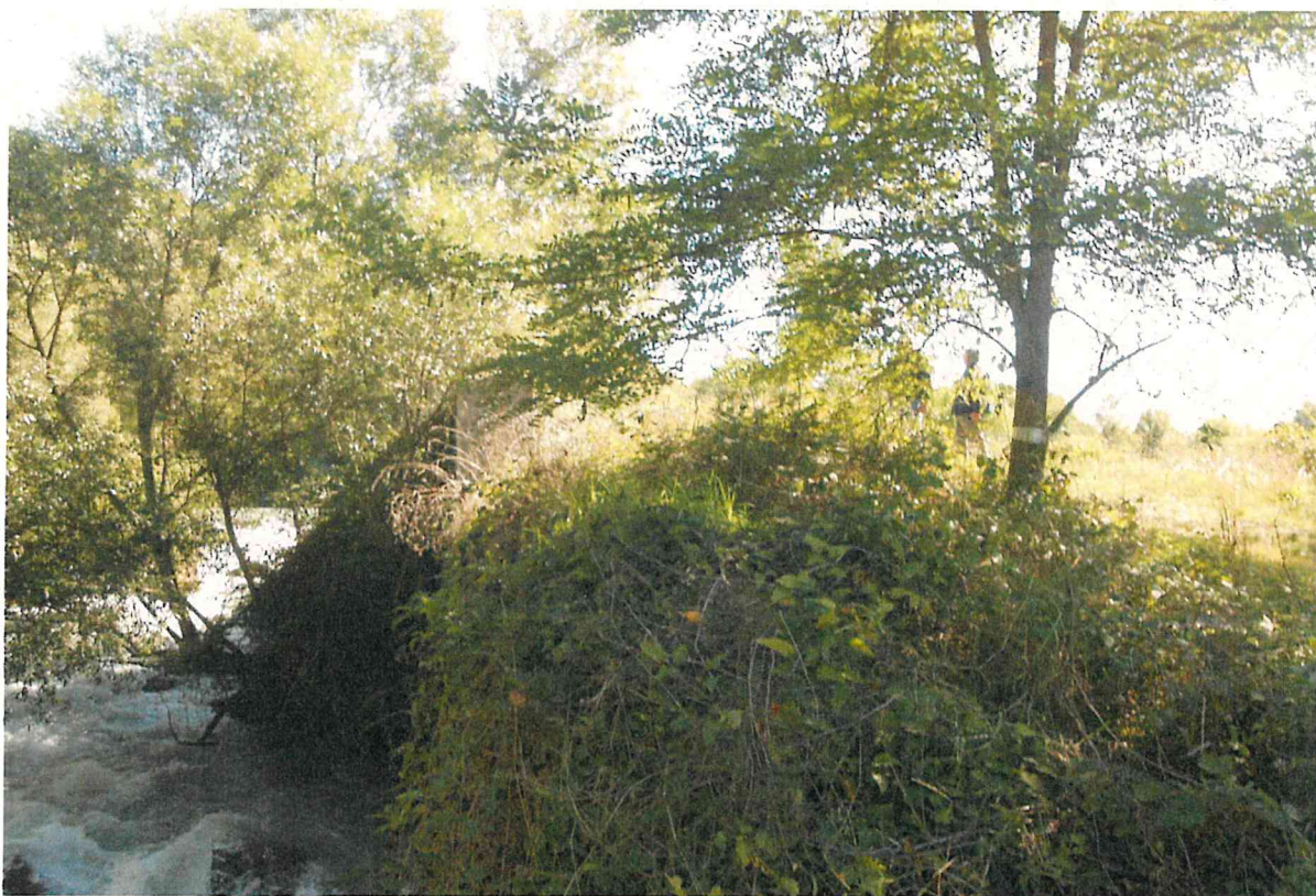
foto 5 vista del fiume e del muro parzialmente coperto dalla vegetazione