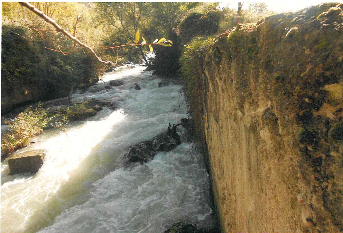
foto 7 vista del fiume da valle