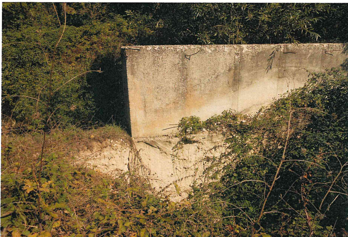
foto 3 vista del particolare del danneggiamento del muro d'argine