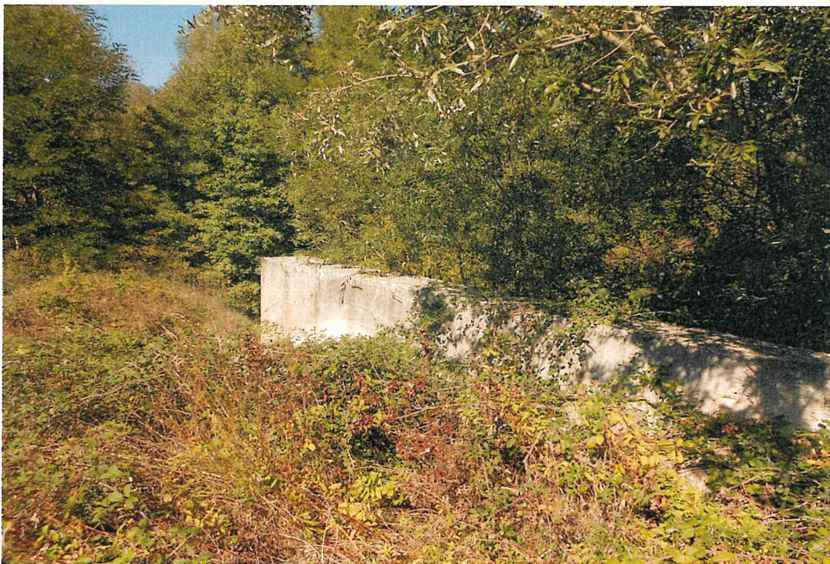
foto 2 vista del muro d'argine in sx idraulica