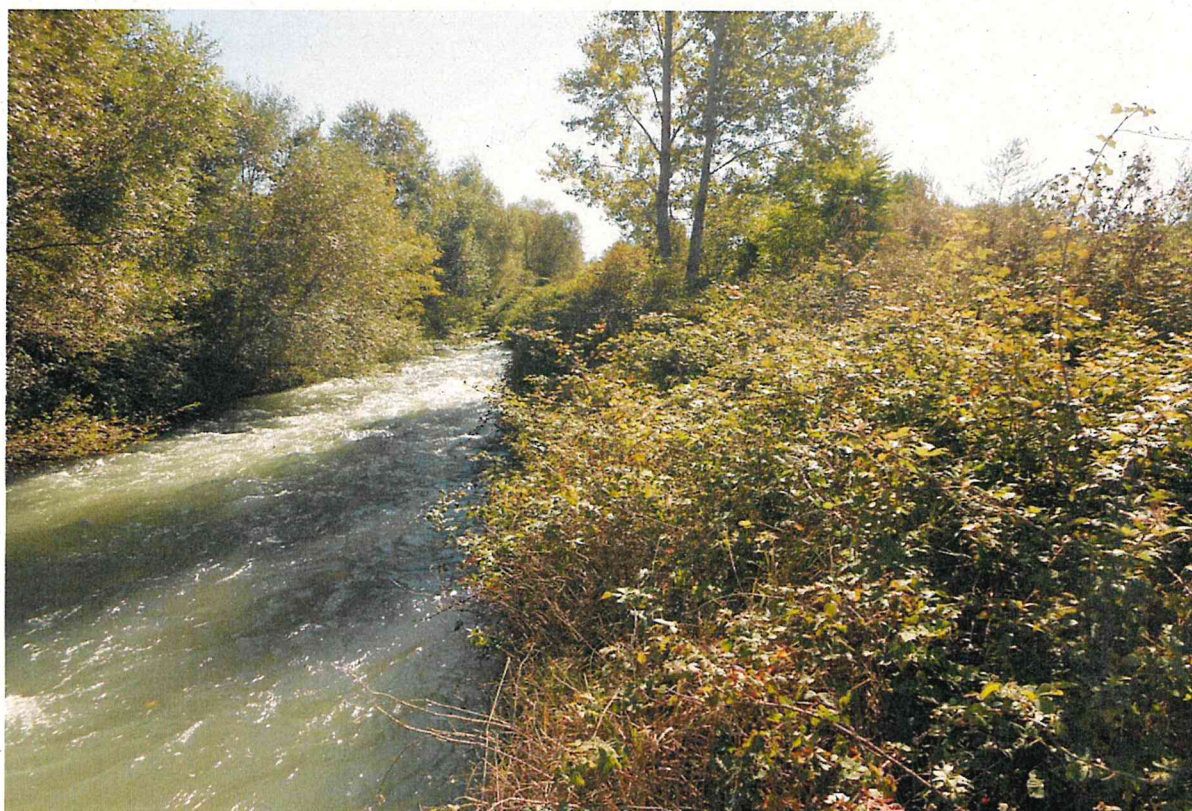
foto 6 vista del fiume da valle