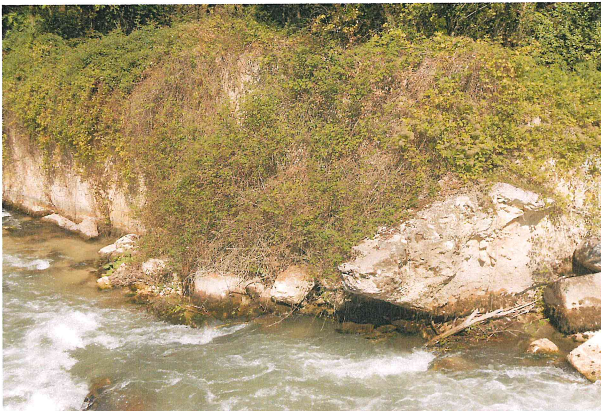
foto 5 vista del fiume e del muro (in dx idraulica) parzialmente coperto dalla vegetazione con presenza di sperone da rimuovere