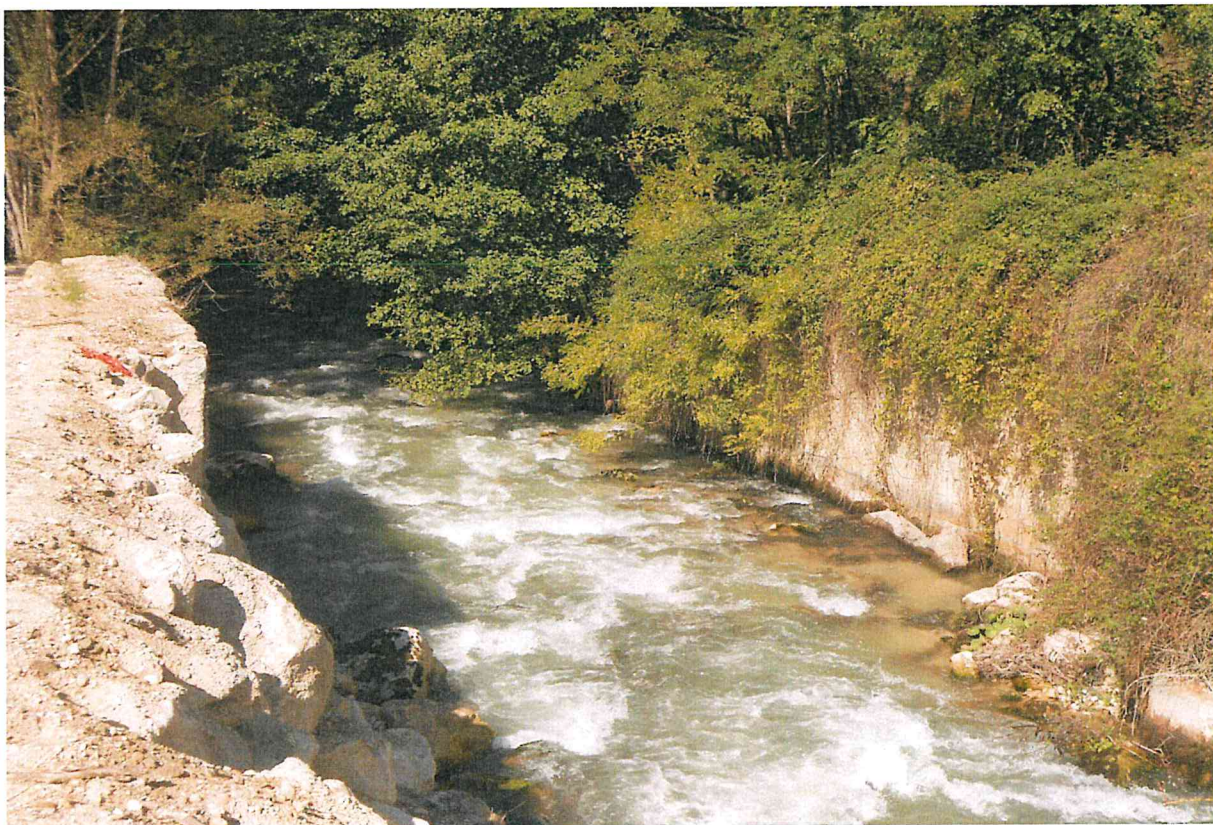
foto 4 vista del fiume da monte