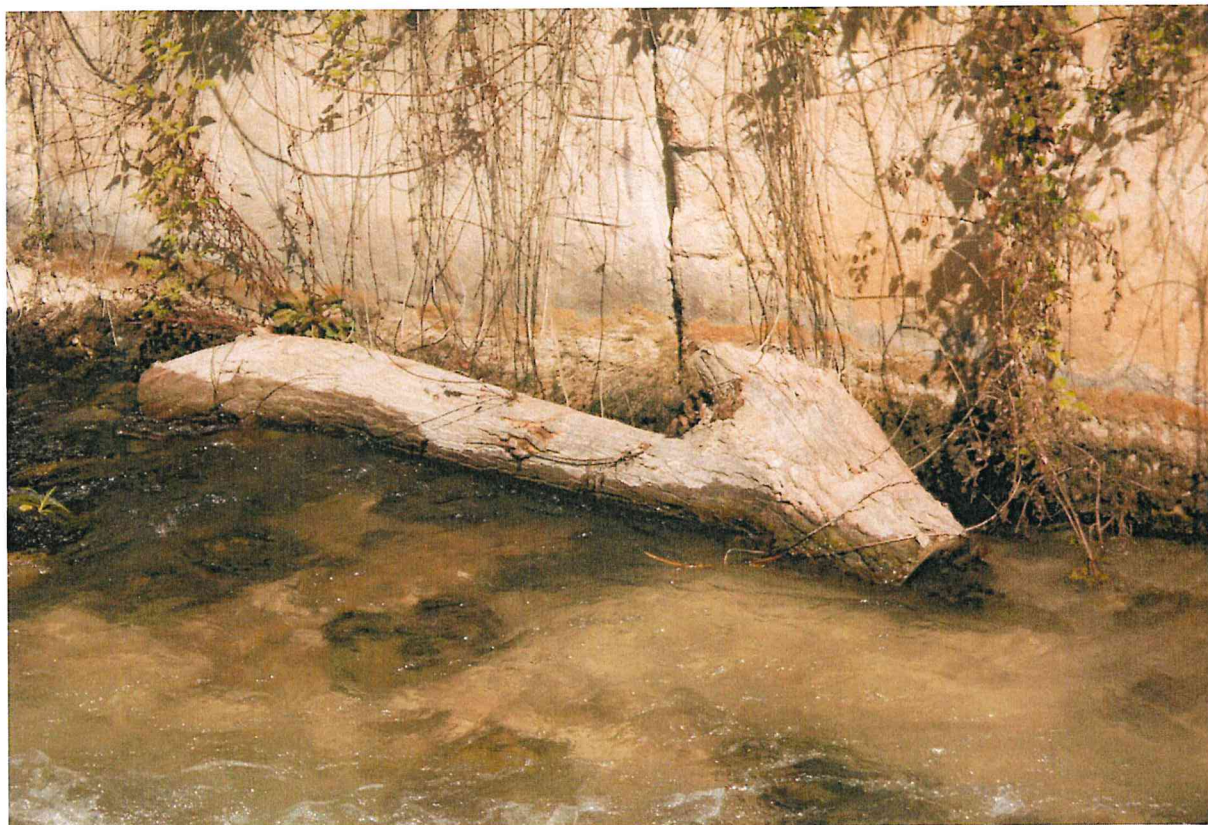
foto 6 vista del fiume con presenza di tronco da rimuovere