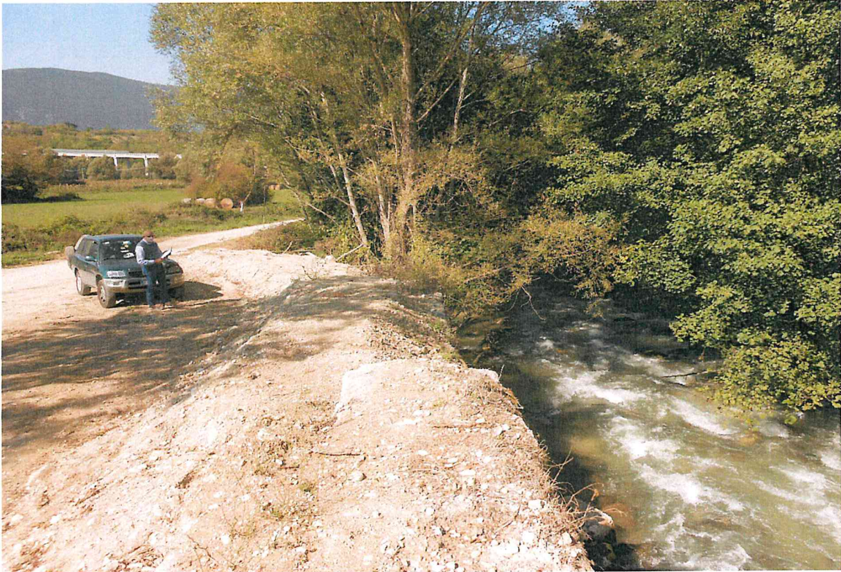
foto 3 vista del muro d'argine in sx idraulica danneggiato