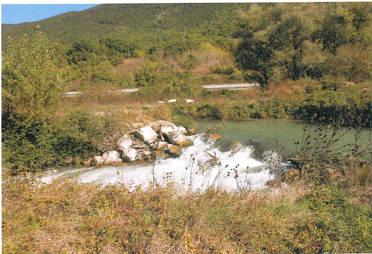
foto 1 vista del fiume e dell'opera di derivazione a monte del tratto danneggiato