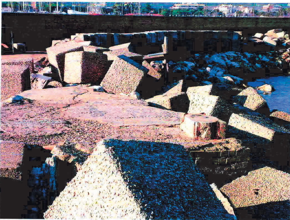
Foto da est verso ovest della base di appoggio del caliscendo con base appoggio vericello e restante passerella in legno

A handwritten signature in blue ink, consisting of a stylized 'F' followed by a cursive name.