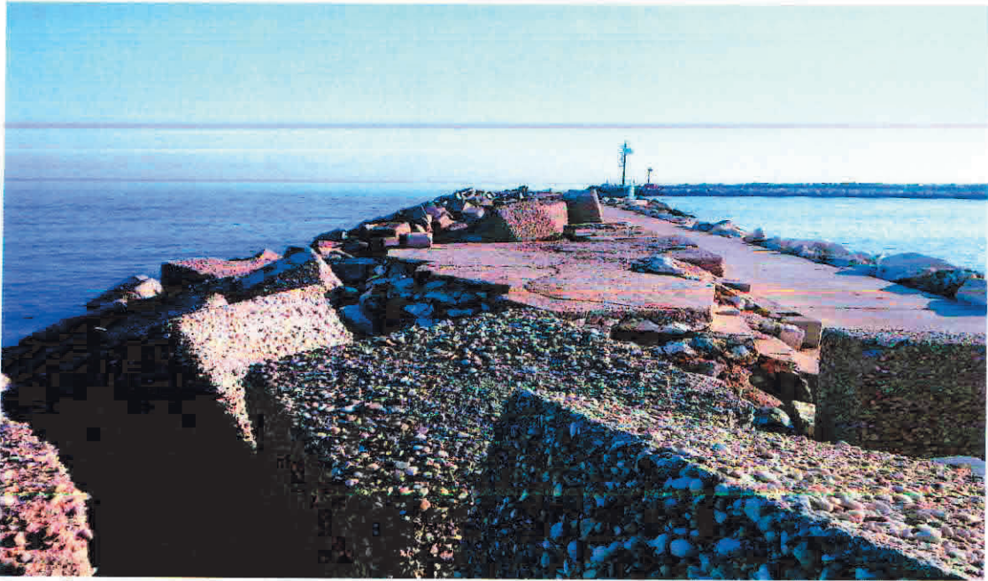
Foto da ovest verso est della base di appoggio del caliscendo con gradini di accesso