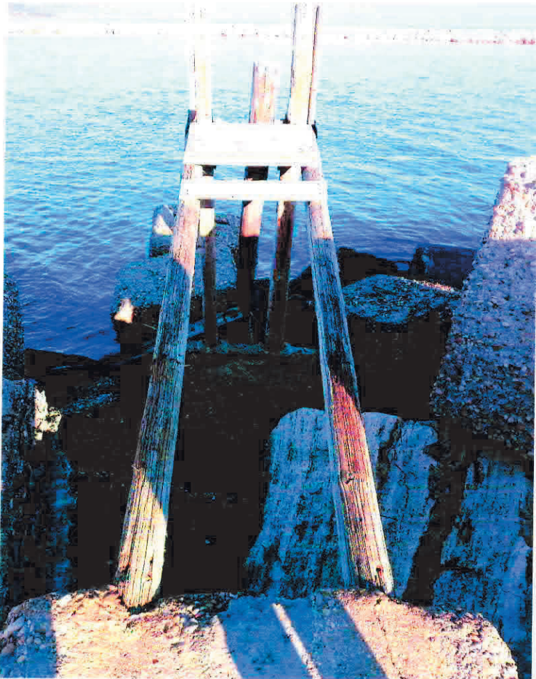
passerella parte rimanente allo stato odierno