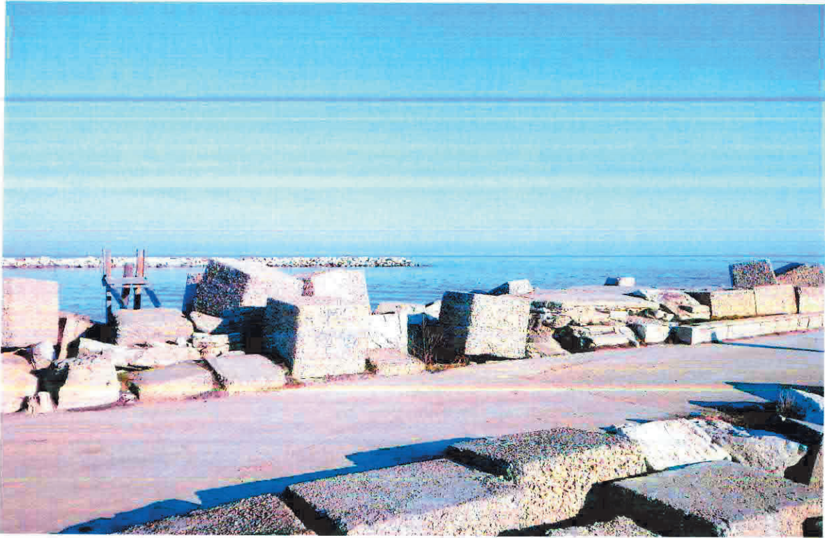
Foto visuale da sud verso nord ingresso, piazzola con base di appoggio, e la passerella rimanente allo stato odierno del caliscendo