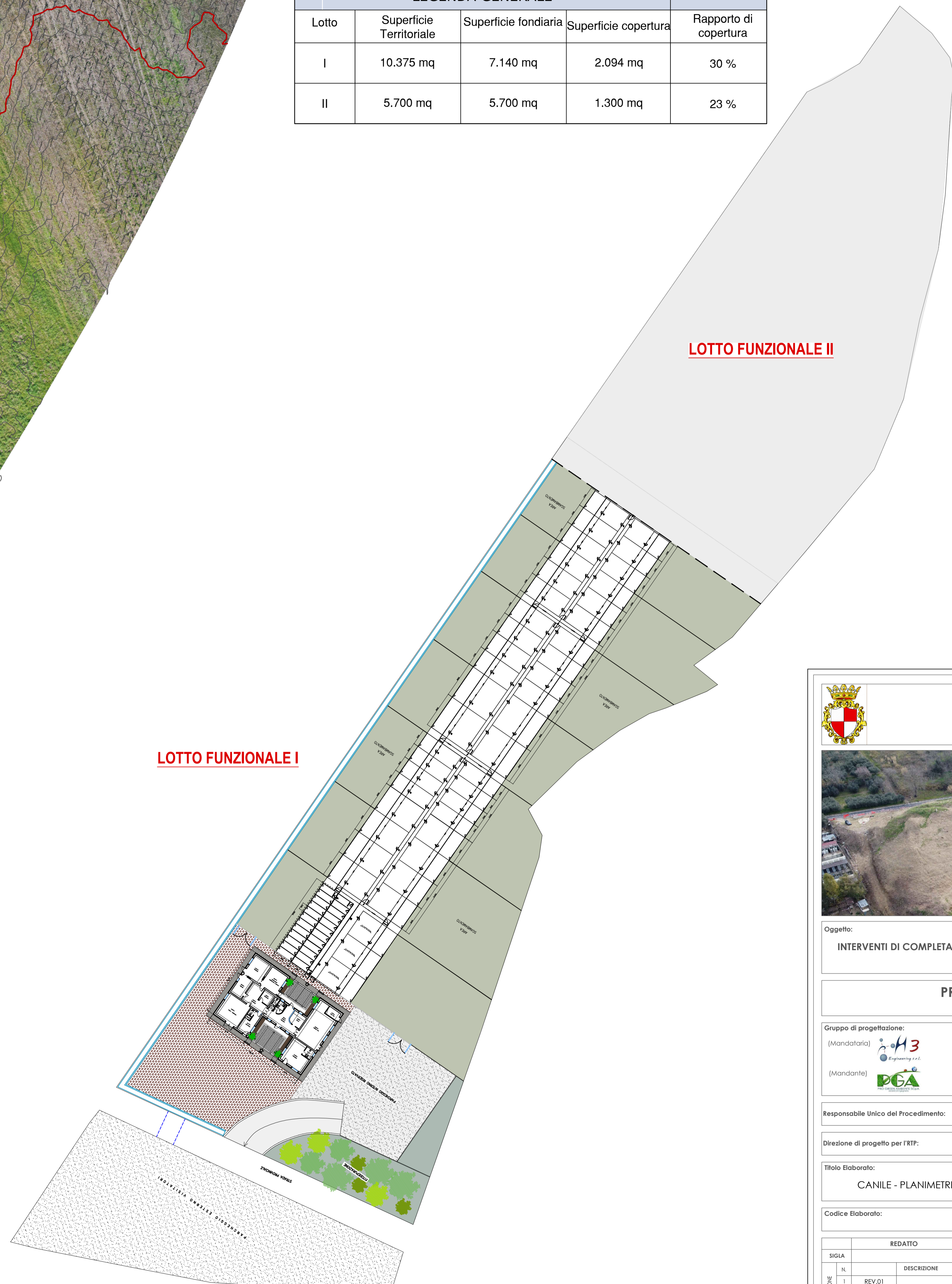
Layout di progetto - Scala 1:500