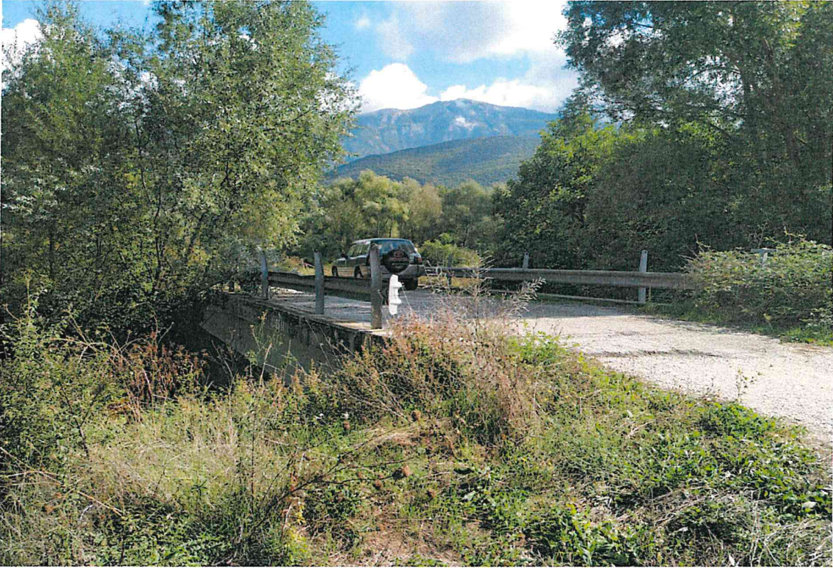
foto 3 vista dell'area del ponte