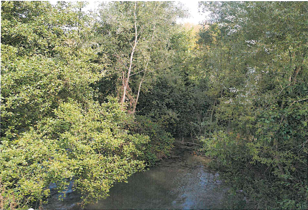
foto 5 vista del fiume lato valle