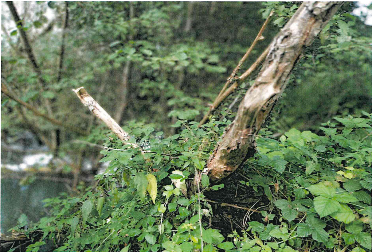
foto 6 vista del fiume con presenza di tronco da rimuovere