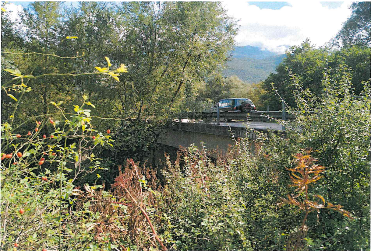
foto 4 vista dell'area del ponte