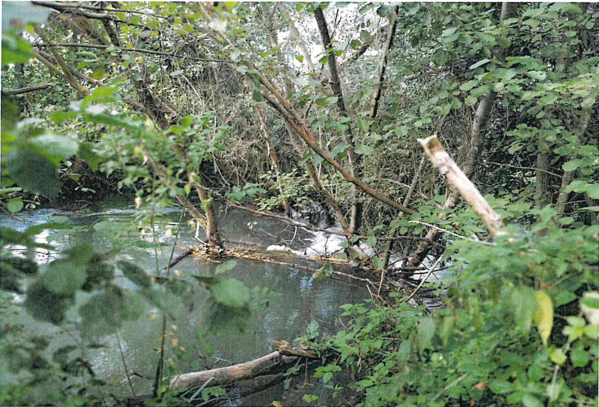
foto 1 vista del fiume e dell'ostruzione lato monte