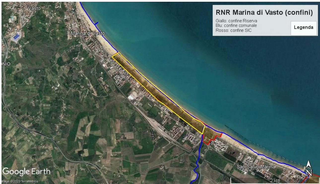
Rapporti tra i confini del SIC e quelli della Riserva