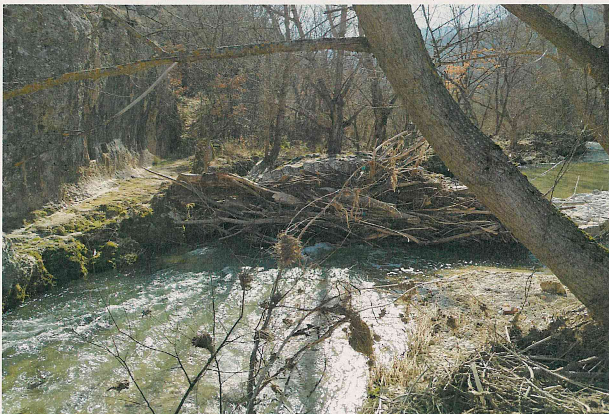
foto 2 vista del fiume in località Beffi lato valle