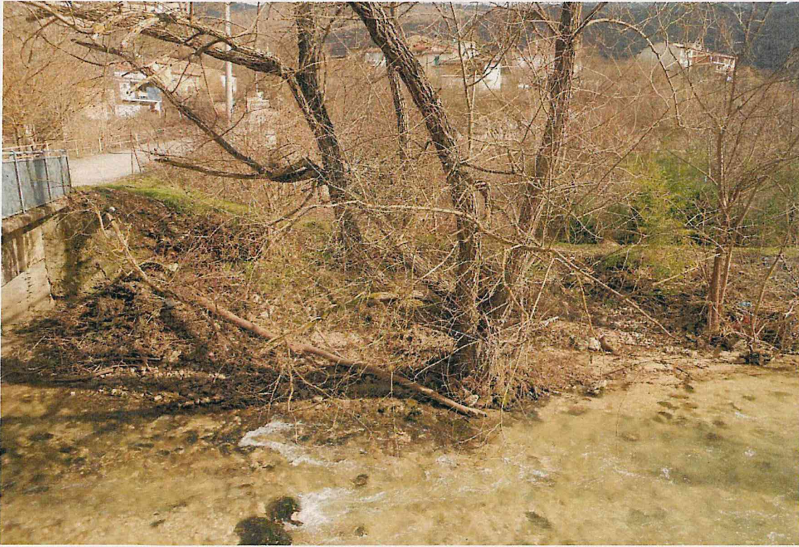
foto 5 vista del fiume in località Molina A. lato valle