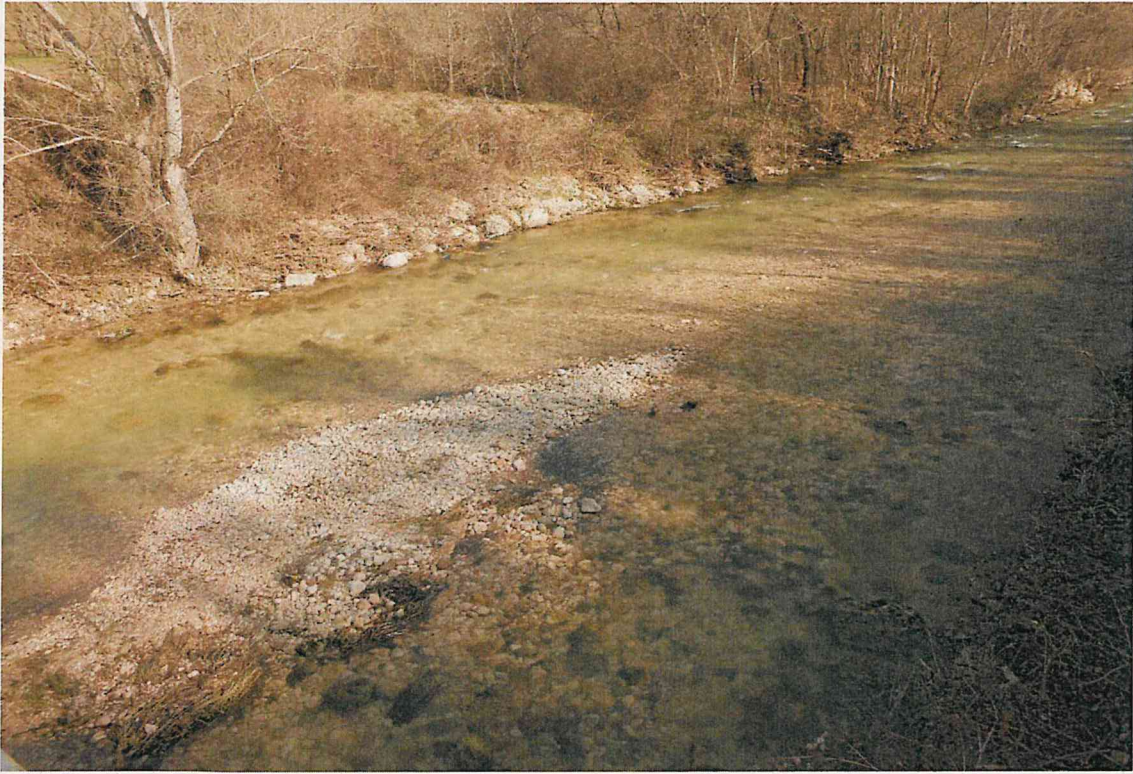
foto 3 vista del fiume in località San'Antonio lato valle