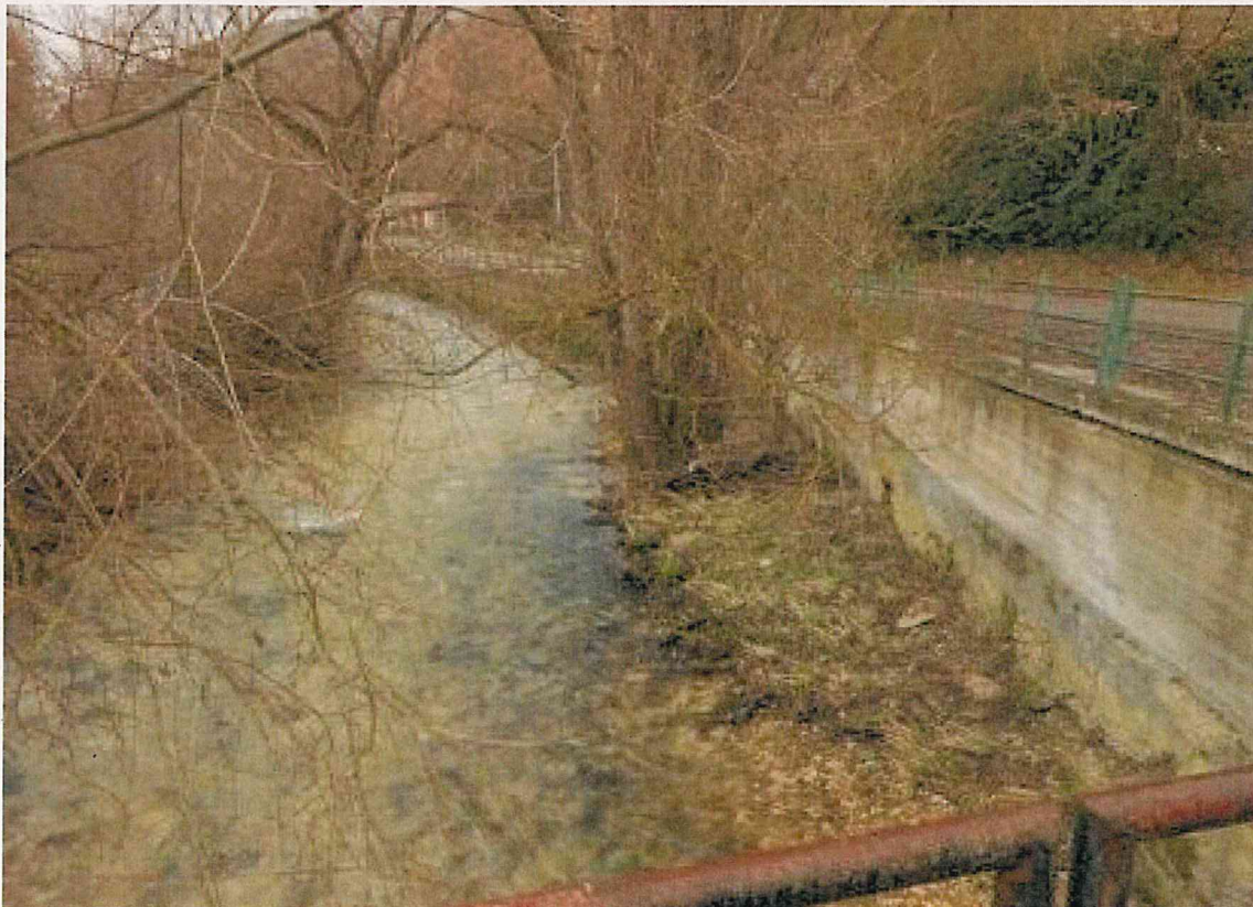
foto 6 vista del fiume in località Molina A. lato valle