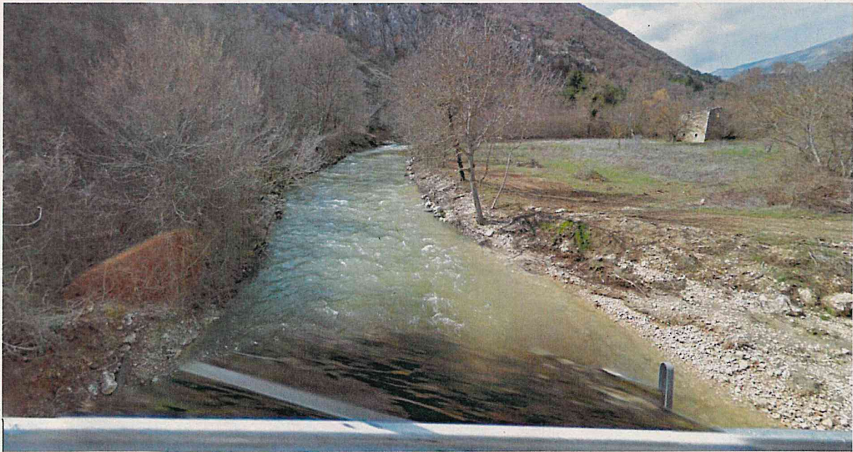
foto 4 vista del fiume in località San'Antonio lato monte