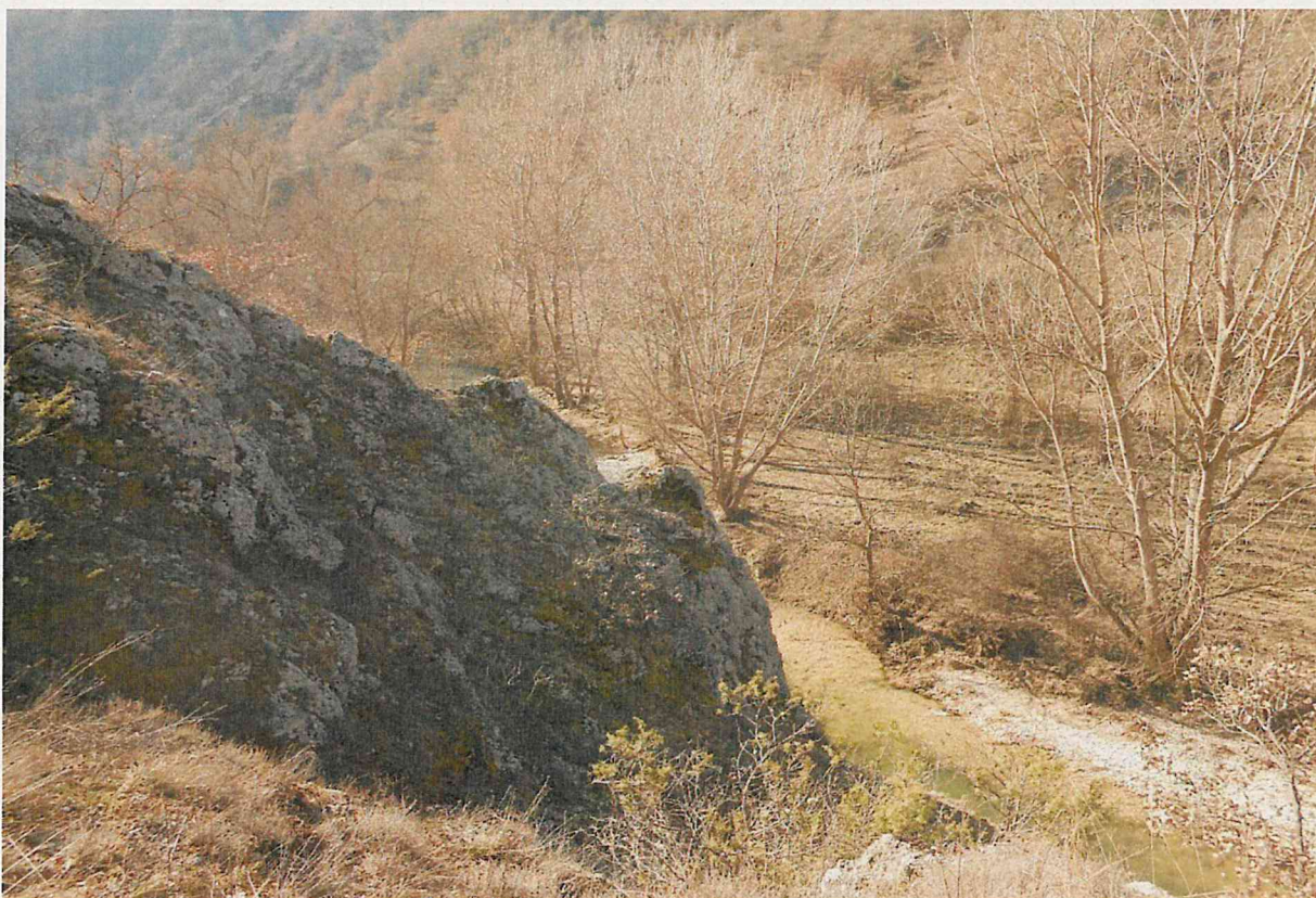
foto 1 vista del fiume in località Beffi