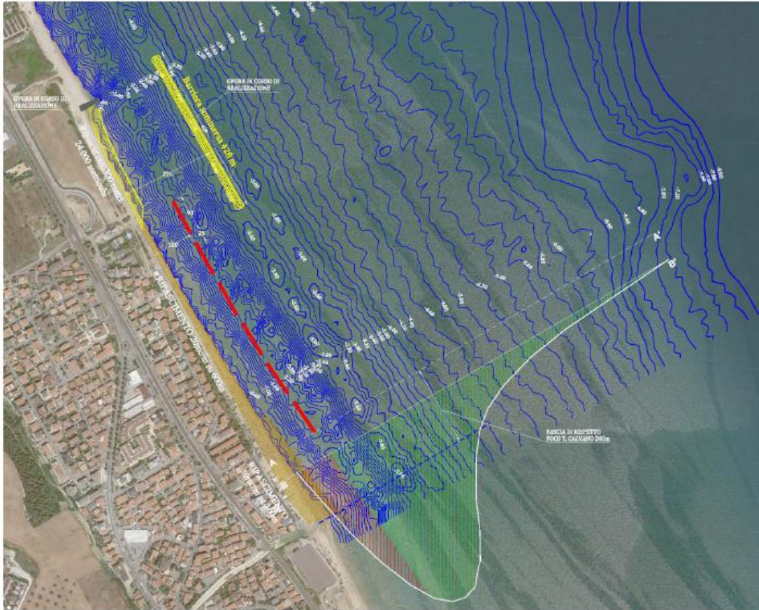
Fig. 1 Rappresentazione schematica del bilancio dei sedimenti sottoflutto delle scogliere emerse con distribuzione della corrente longitudinale

di dissipare l'energia delle onde nel tratto a riva delle opere stesse annullando la corrente e quindi parte della portata solida longitudinale (parte rossa della distribuzione).