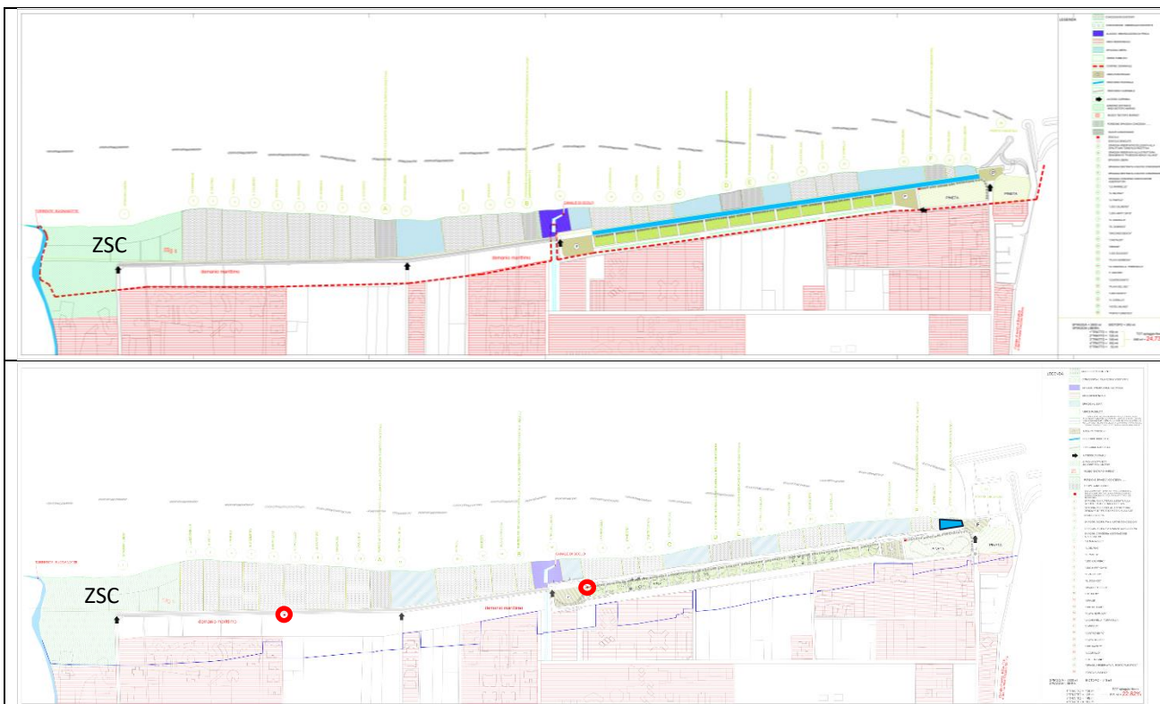
Figura 1 . Confronto fra le previsioni del vigente PDMC (in alto) e della sua Variante (in alto: perimetro della ZSC in verde a sinistra; in basso: cerchi rossi=edicole demolite da trasformare; trapezio blu=nuova concessione)

La Variante recepisce anche tutti gli obiettivi della L.R. 141/1997, partendo dall'analisi territoriale del PDMC, nella quale vengono analizzate e interpretate le interazioni tra i diversi “sistemi” (ambientale, infrastrutturale, insediativo), e concludendo con l'inserimento delle innovazioni descritte, che diventano elementi caratterizzanti del nuovo assetto urbanistico-gestionale della fascia costiera di San Salvo.