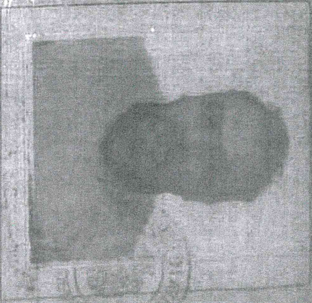
Foto del richiedente