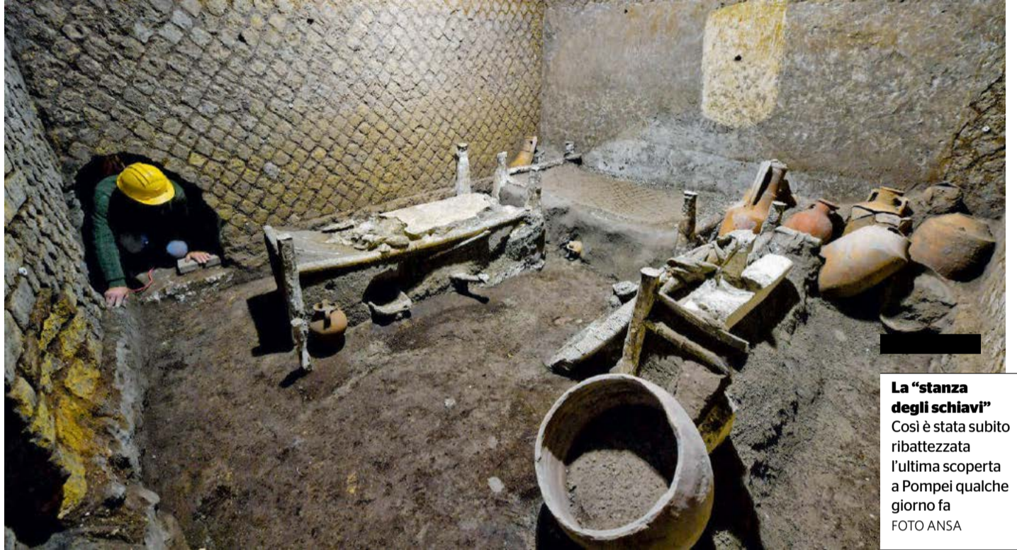
La “stanza degli schiavi” Così è stata subito ribattezzata l'ultima scoperta a Pompei qualche giorno fa

Non è un atteggiamento mediatico che riguarda solo Pompei, divenuta vessillo di “successo, rinascita e riscatto”, u-