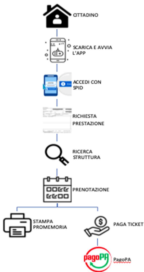
Figura 1 Prenotazione on-line

Di seguito alcuni esempi di cosa potrà fare un cittadino attraverso i nuovi servizi digitali che verranno messi a disposizione: