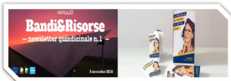
La newsletter Bandi & Risorse e i materiali a stampa sono alcuni degli strumenti utilizzati per la promozione e l'informazione delle opportunità offerte dall'Unione Europea tramite il Programma POR FESR.

La comunicazione off line prevede interventi di informazione e pubblicità rivolti al grande pubblico affiancati e rafforzati dalla comunicazione on line. In questo tipo di comunicazione si collocano la newsletter Bandi&Risorse , i passaggi tabellari sui principali quotidiani abruzzesi, i comunicati stampa diffusi periodicamente, i materiali informativi a stampa .