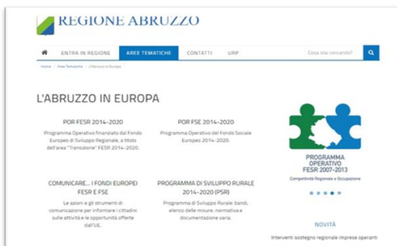
La sezione 'Abruzzo in Europa' del sito internet della Regione Abruzzo è l'elemento cardine della strategia di comunicazione del POR FESR

Al sito si affiancano i profili Facebook "Regione Abruzzo" e "Abruzzo Regione aperta" per i servizi al cittadino, anche se tutta la strategia dei social, per il 2021, ricondotta alla sola comunicazione europea, con ciò rispondendo anche ad un indirizzo del Valutatore.