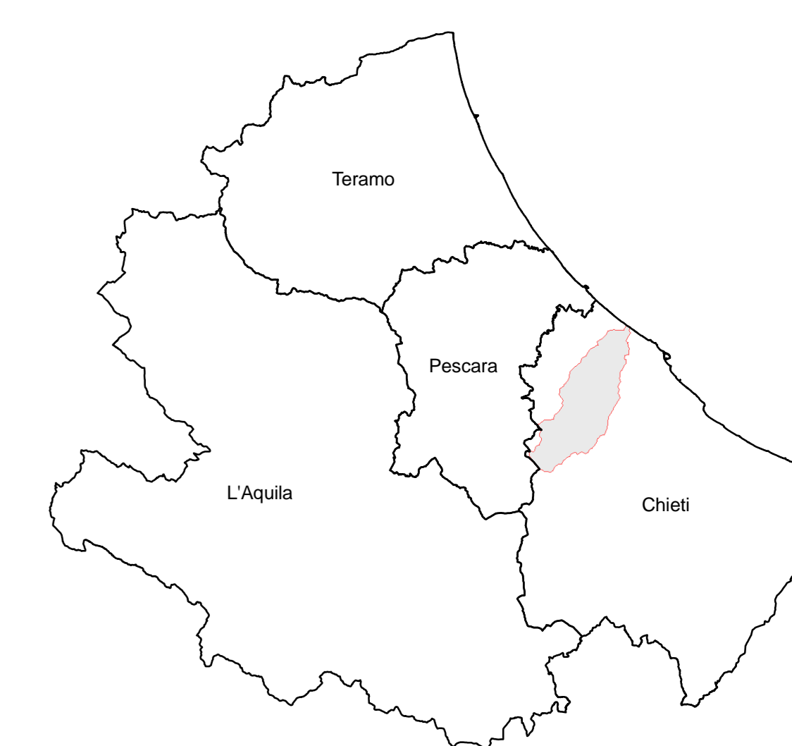
Inquadramento Regionale del Bacino del Fiume Foro Scala 1:1.000.000