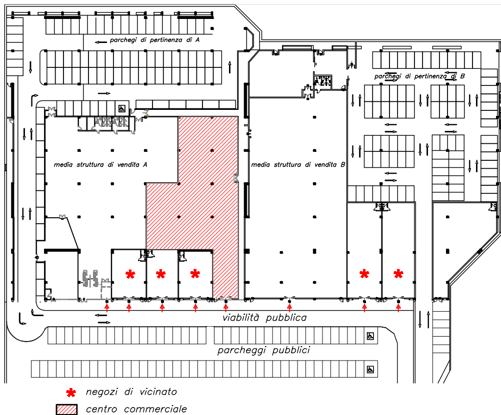
All.n° 6 PLANIMETRIA D'INSIEME DELL'EDIFICIO scala 1:500