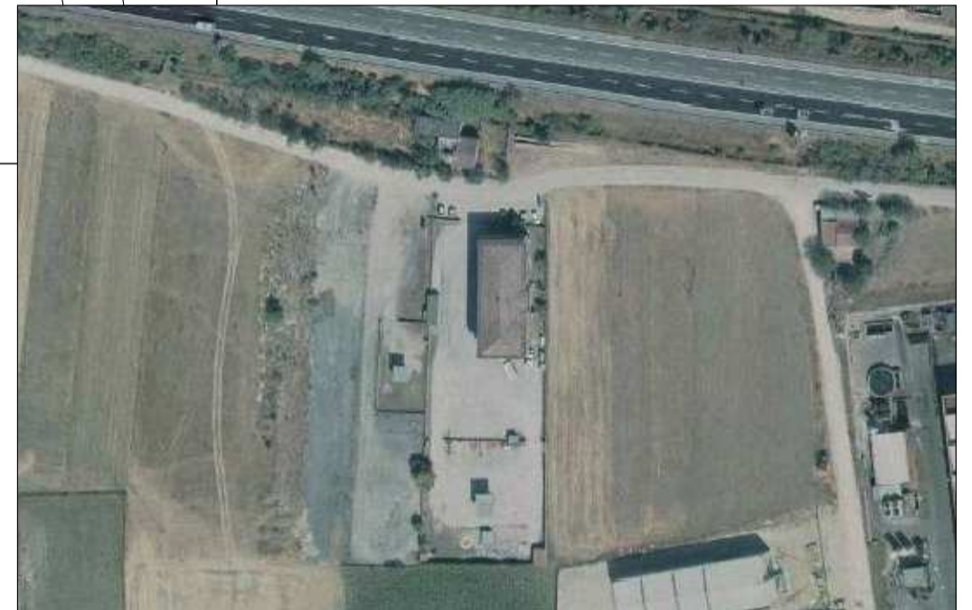
FOTO AEREA AREA