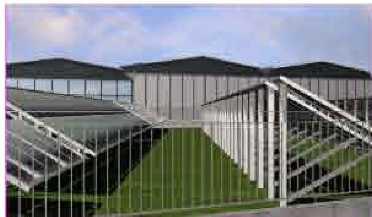
FOTO RENDER 2