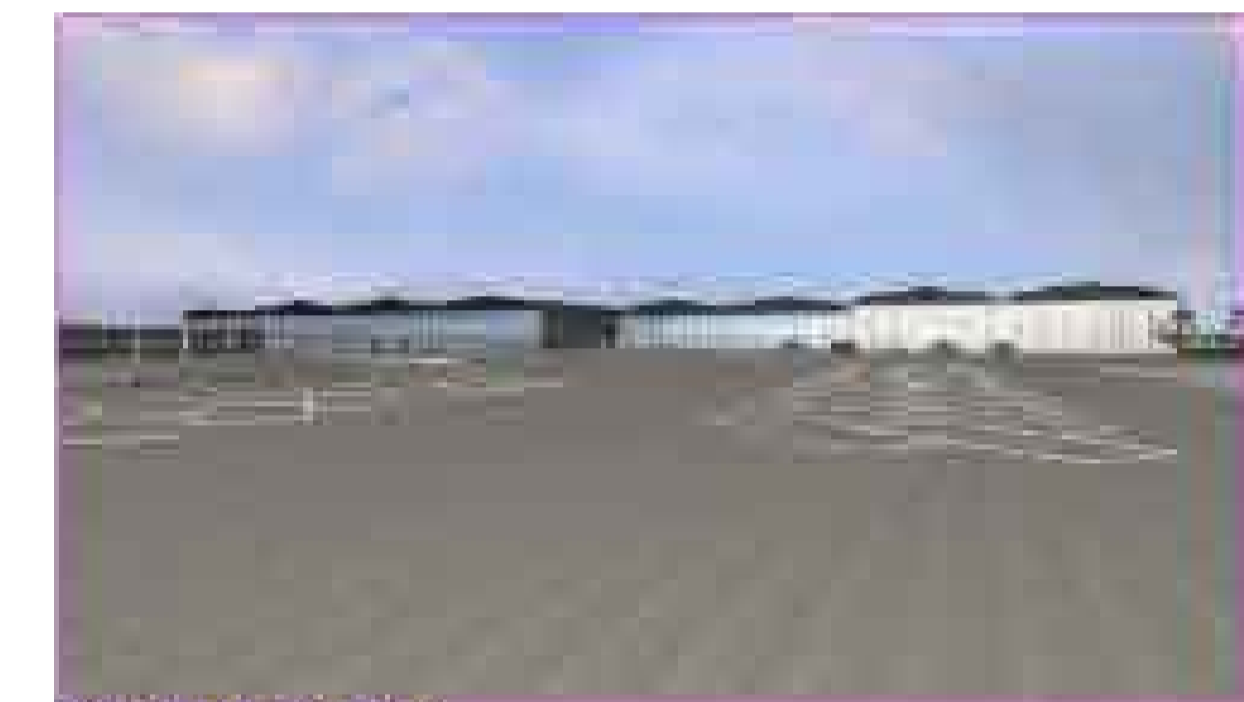
FOTO RENDER 6