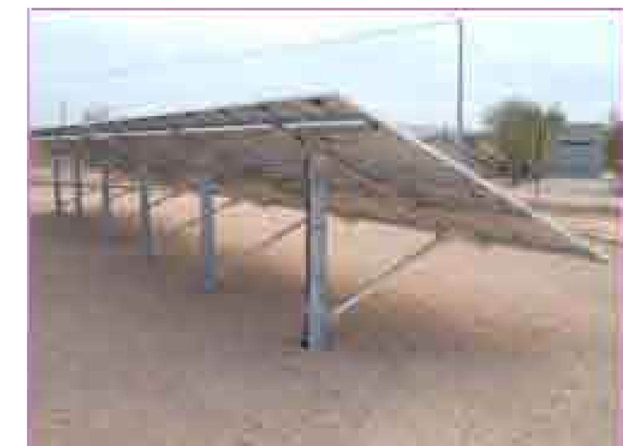
IMMAGINE PANNELLI TIPO E SUPPORTI