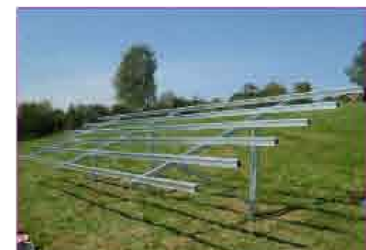
IMMAGINE SUPPORTO TIPO IN FASE DI MONTAGGIO