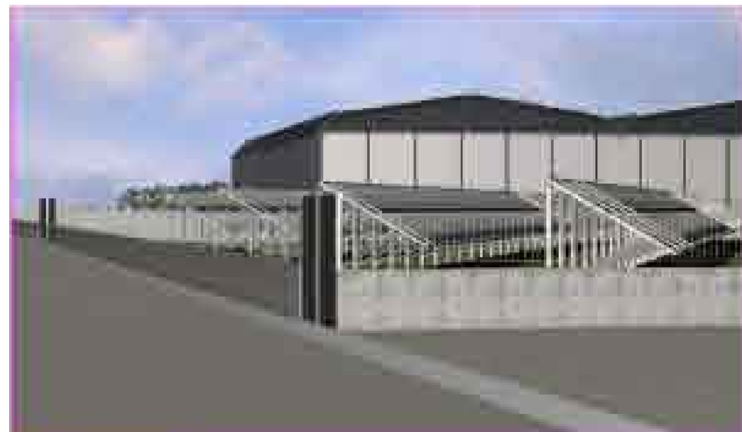
FOTO RENDER 1