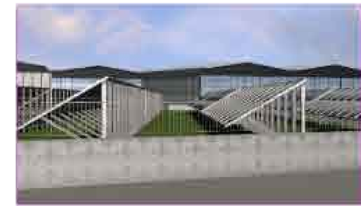
FOTO RENDER 4