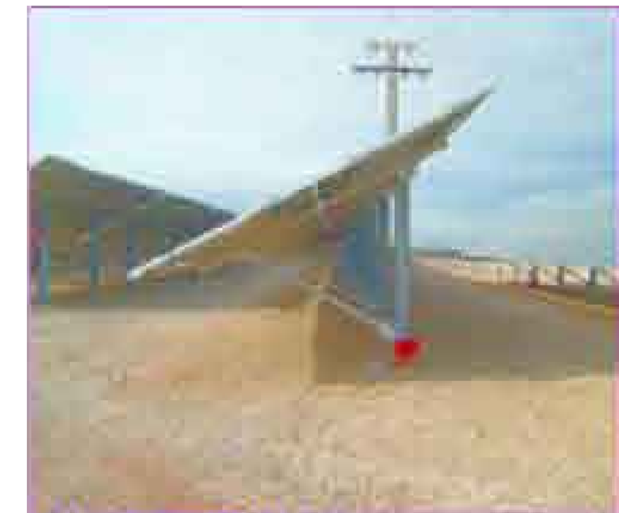
IMMAGINE STRUTTURA TIPO