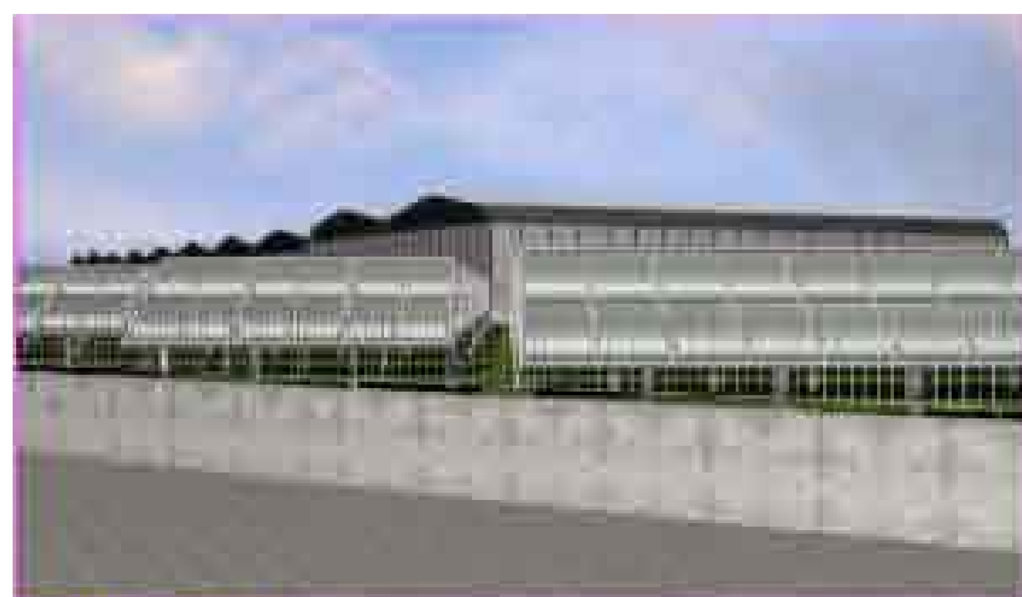
FOTO RENDER 3